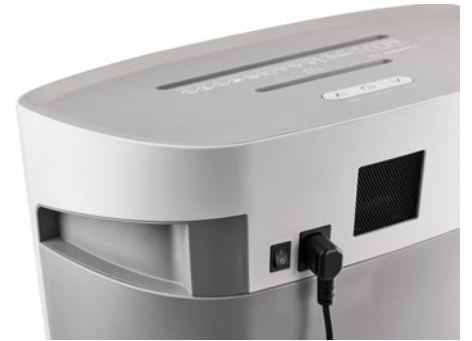
Dahle Aktenvernichter PaperSAFE® 420