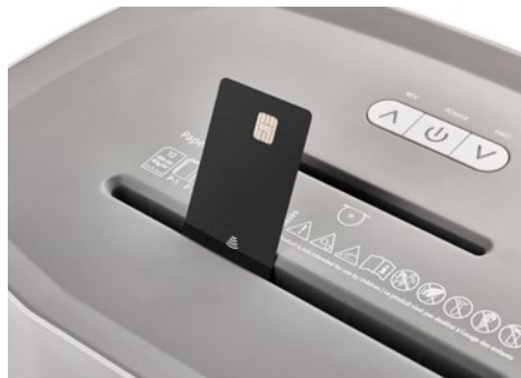
Dahle Aktenvernichter PaperSAFE® 420