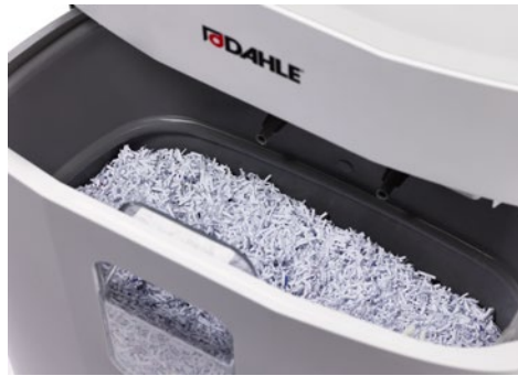
Dahle Aktenvernichter PaperSAFE® 420