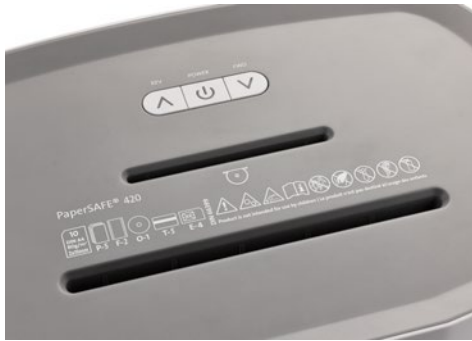
Dahle Aktenvernichter PaperSAFE® 420