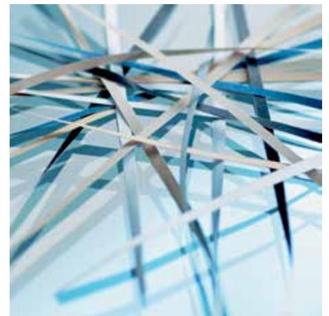
Sicherheitsstufe P-2: Empfohlen für Datenträger mit internen Daten, die unlesbar gemacht werden sollen