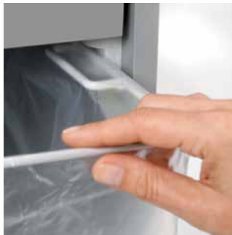
Ausziehbare, abgerundete Schiene ermöglicht das komfortable Wechseln des Auffangbeutels