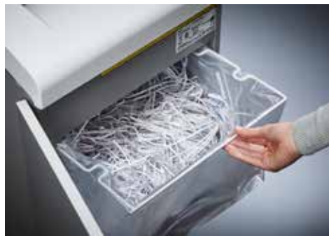
Dahle Aktenvernichter Waste 204