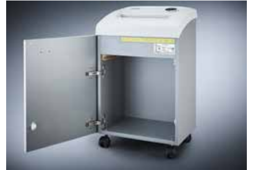
Dahle Aktenvernichter Waste 204