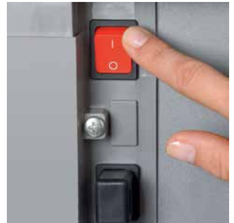
Separater Hauptschalter befindet sich auf der Rückseite des Aktenvernichters und trennt diesen komplett vom Netz