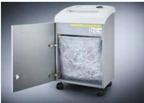
Dahle Aktenvernichter Waste 204