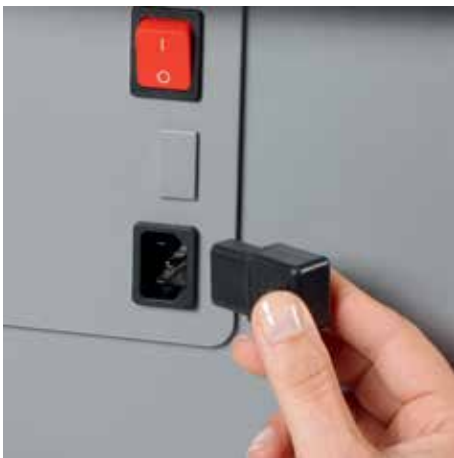
Abziehbarer Kaltgerätestecker vereinfacht das schnelle Bewegen des Aktenvernichters von A nach B